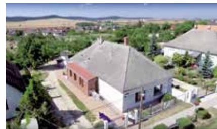
Képeink a Hosszú út c. filmből valók

berke Alapítvány a Vas Megyei Autistákért, a másik a Zala megyei Alapítvány az Autista Gyermekéért.