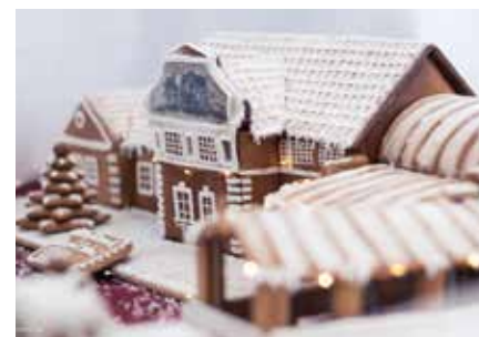
A miskolci Szimbiozis Alapítvány Mézes Miskolc címmel kiállítást rendezett a városházán a Fogyatékos emberek világnapján, december 3-án. Az alapítvány gasztroműhelyében foglalkoztatottak mézeskalácsból készítették el Miskolc nevezetes épületeit.