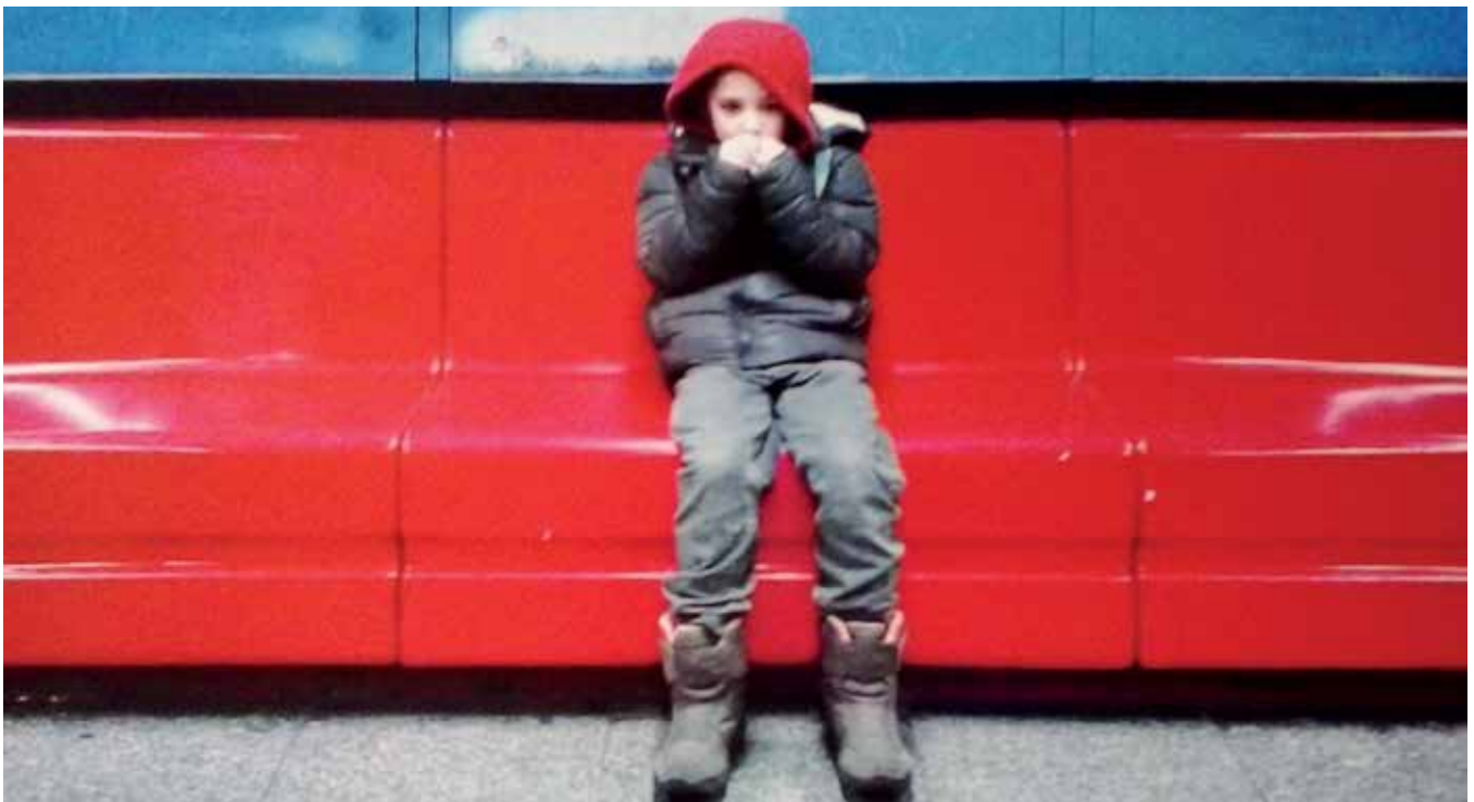
Fotó: Daniss-Bodó Eszter kiállításáról. További képeket a 20. oldalon találunk