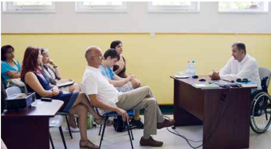
Békéscsaba: Szekeres Pál, miniszteri biztos előadást tart

Az AOSZ tavaly szeptembere óta szervezi a hálózat kiépítésével kapcsolatos programjait. Célja: úgy megerősíteni egy-egy vidéki tagszervezetet, hogy az adott térségben képviselni tudja tagjai érdekeit.