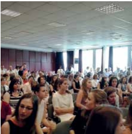
Még a diploma kiosztása előtt

Nevezetes nap volt 2015. július 17-e a magyar gyógypedagógia életében. Először adtak diplomát autizmuspektrum pedagógiája szakirány alapszakán végzetteknek. Tizennégyen nappali tagozaton, kilencen az estin tanultak. Mi a nappali tagozatosok diplomaosztóján jártunk.